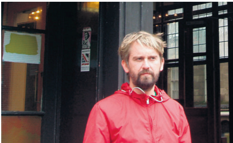
«Acceso al comportamiento» es el segundo libro de Antonio Doñate, después de «La paz social»

Mientras La paz social examinaba las distintas aristas de las frustraciones de aquel grupo generacional, Acceso al comportamiento gira en torno a un único protagonista con sus satélites familiares, laborales y amistosos. Rafa es un estudiante brillante que, sin que exista causa aparente, cambia un prometedor futuro universitario —el primero de su familia— por una serie de trabajos manuales y fabriles que finalmente desembocan en gestionar el día a día del quiosco de prensa del aeropuerto de Vigo: una ocupación sin grandes exigencias, agradablemente rutinario pero sin caer en la monotonía y ubicado en un «no